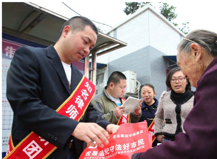
四川眉山普法活动