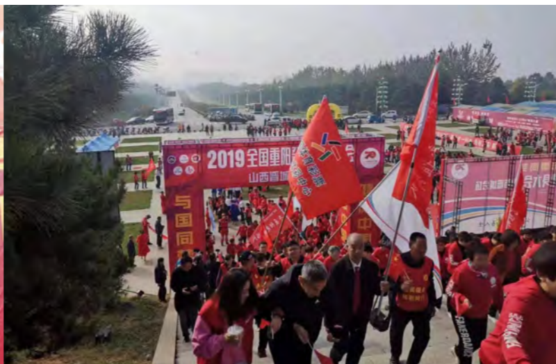
山西晋城登高大会活动现场

市老年人体育协会、大众文化娱乐协会为健身大会带来了精彩的节目表演！现场千人合唱《我爱我的祖国》，为新中国70周年华诞献礼。