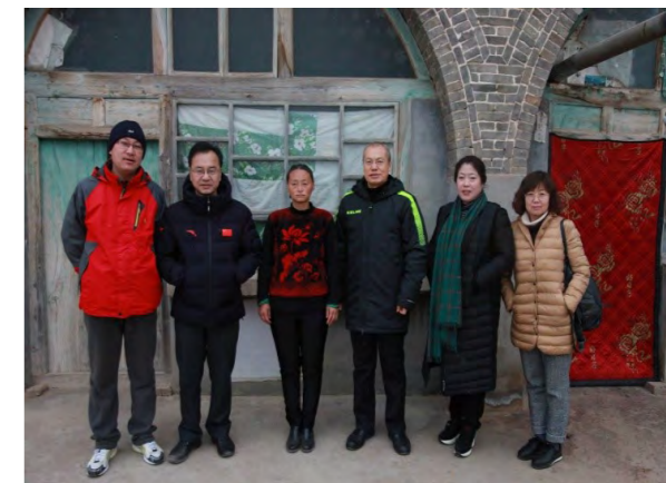
(山西省体育彩票管理中心 公共关系部供稿)