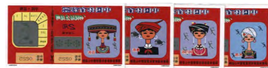
第五届全国运动会·昆明”系列