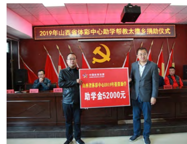
山西省体育局党组书记、局长赵晓春向太德乡发放助学金