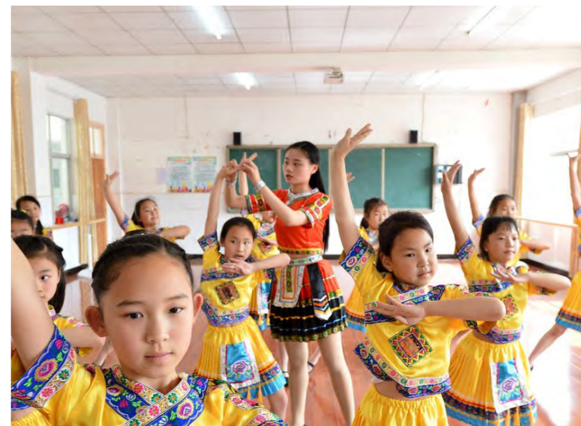
湖北省保康县马桥镇小学少年宫